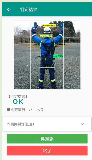
アプリによる装着判定結果